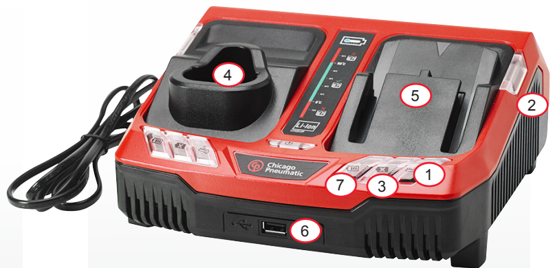
Abbildung zeigt CP12-20CH DUAL EU Dual-Ladegerät für 1x 12Volt und 1x 20-Volt Akkus.