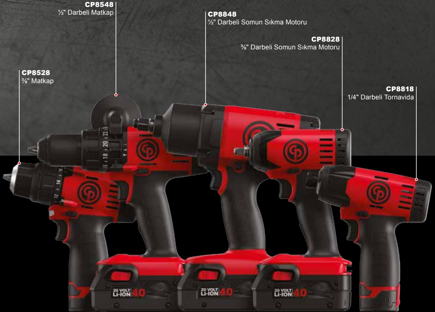
CP8528 3/8" Matkap