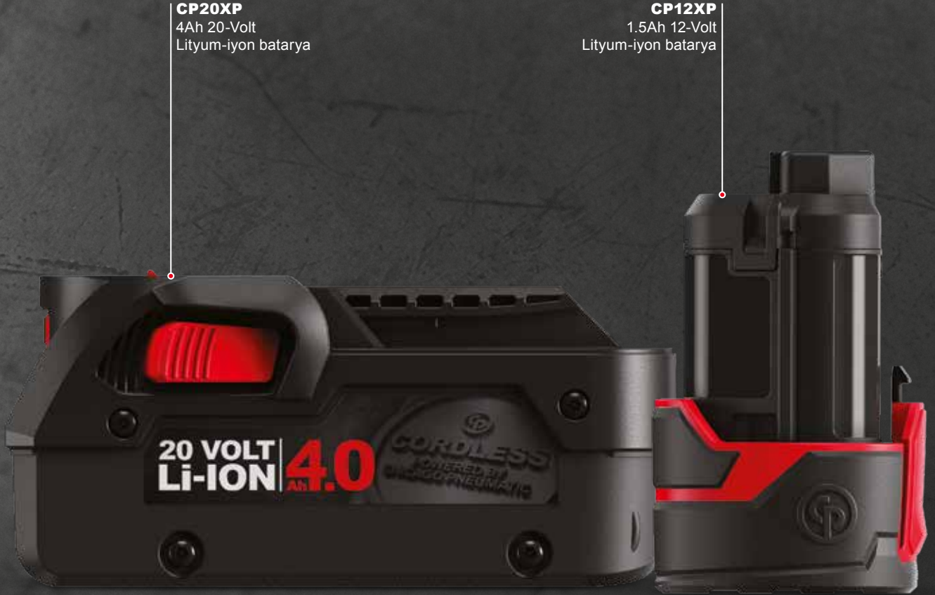
CP20XP 4Ah 20-Volt Lityum-iyon batarya