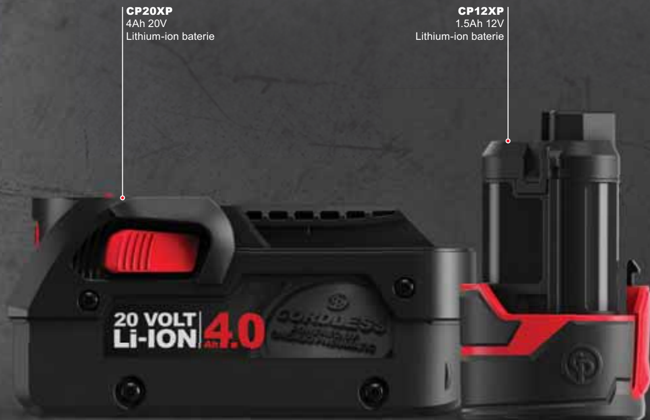
CP20XP 4Ah 20V Lithium-ion baterie