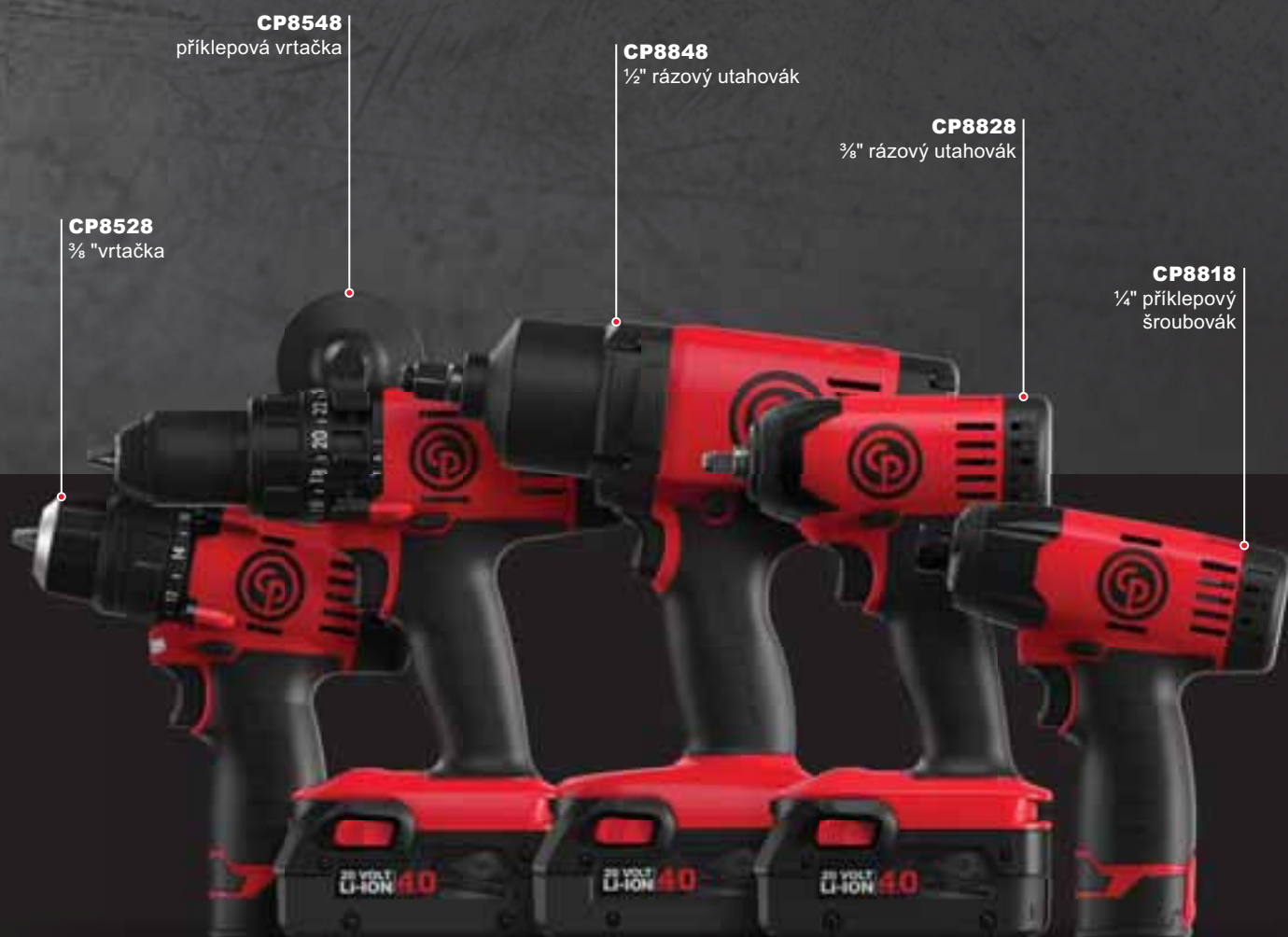
CP8548 příklepová vrtačka