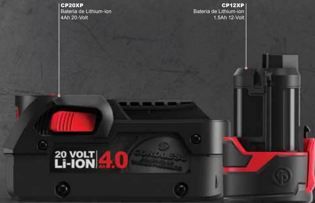
CP20XP Bateria de Lithium-ion 4Ah 20-Volt